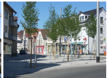
Kirchheim – Schwetzinger Str.